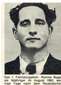
Das 1. Fahndungsfoto: Ronnie Biggs als 34-jähriger im August 1963, wenige Tage nach dem Raubüberfall

Die Postraubgang wird jetzt gehetzt; auch Biggs ist sehr bald festgesetzt Es folgt, zeitlebens ihm verhasst, ein Weilchen Lebenszeit im Knast, bis Ausbruch ihm gelingt und Flucht. Doch Biggs, jetzt umso mehr gesucht, hat längst verändert sein Gesicht, und hofft, man finde so ihn nicht.