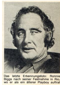
Das letzte Erkennungsfoto: Ronnie Biggs nach seiner Festnahme in Rio, wo er als ein älterer Playboy auftrat

Das Geld vom Raub ist aufgebraucht Biggs lebt fortan nur abgetaucht, setzt bald sich nach Australien ab, bis man ein Bild von ihm druckt. Knapp entkommt er seinen Häschern dort. Brasilien wird sein Zufluchtsort; in Rio sitzt er drauf und sinnt, wie er sein Leben weiter spinnt.